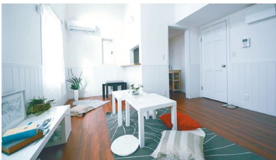
◀白を基調とした部屋は明るく開放的だ