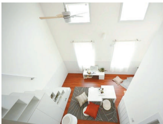
▲ロフトから居室を見下ろす