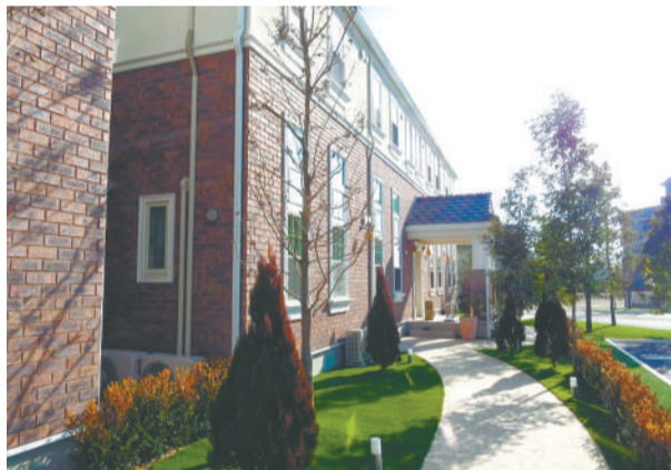
▶エントランスへと続くアプローチ

さながらイングリッシュガーデンのような外観、優雅さを追求した設計に加え、ホームページや入居者向けイベントを通じた情報発信で入居待ちを生む女性専用アパートメントを紹介する。