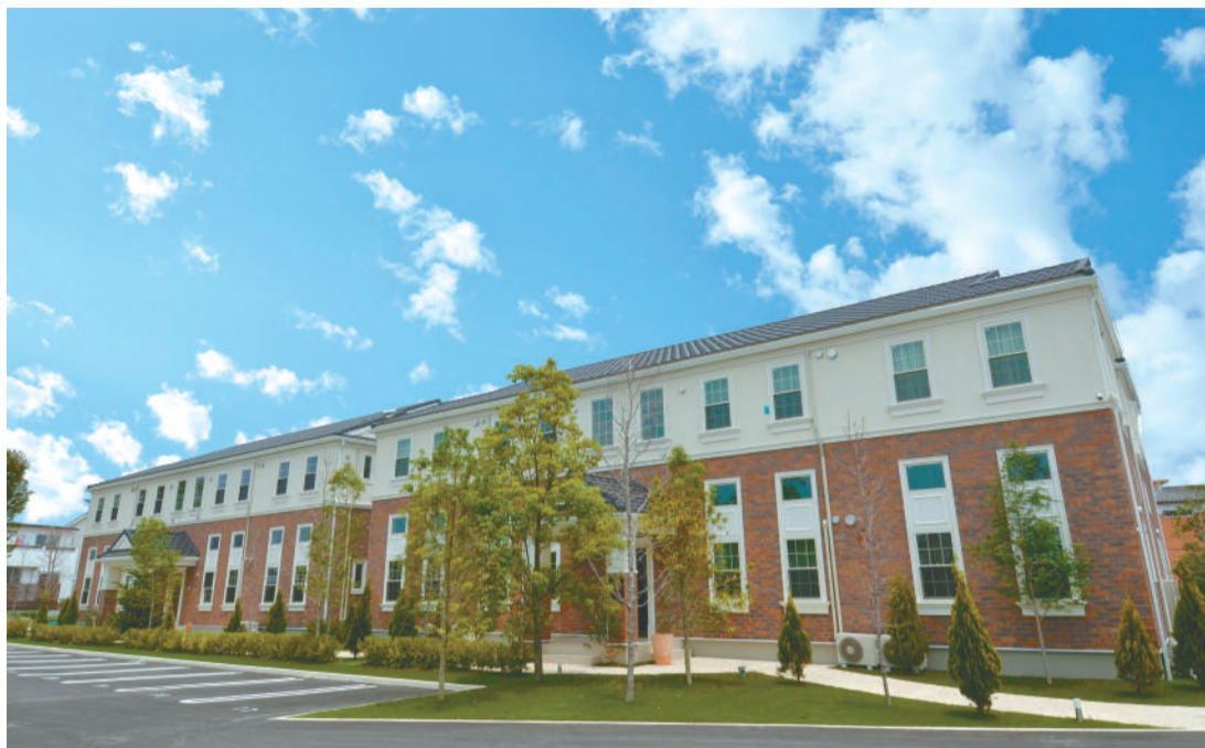
▶青空に映えるヨーロッパテイストのアパート。大きな窓も特徴的だ